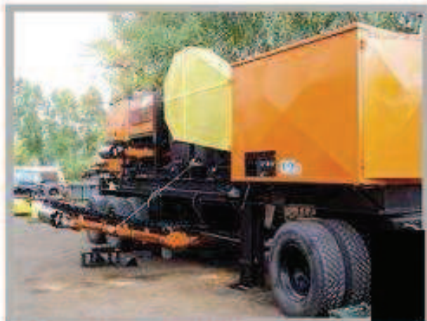
1. Przejezdny zestaw kruszący typ 180.2 w przygotowaniu do transportu (na zdjęciu bez kosza zasypowego)